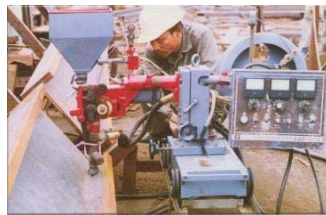
Hàn chế tạo sản phẩm bằng máy hàn tự động sông Ba Hạ