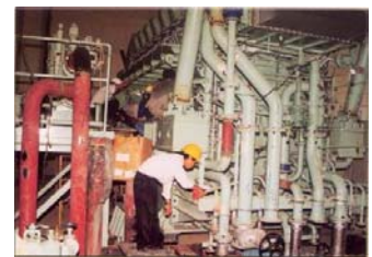
Trạm phát điện DIEZEL 24.000 MVA - SAOMAI