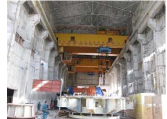
Lắp đặt máy phát thủy điện sông Ba Hạ