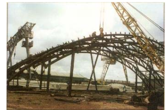
Chế tạo vì kèo nhà vòm, khẩu độ 58m cho nhà máy xi măng Sao Mai