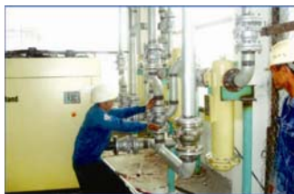
Cung cấp và lắp đặt hệ thống ống và thiết bị Nhà máy sơn ICI- Mỹ Phước - Bình Dương