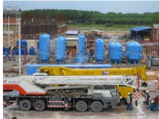
Lắp đặt nhà máy giấy bình dương Vina KRAF