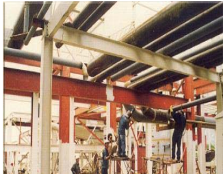
Hàn ống dẫn dầu cho nhà máy nhiệt điện Phú Mỹ