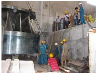
Tổ hợp và lắp đặt bánh xe công tác Thủy điện sông Ba Hạ