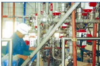
Cung cấp và lắp đặt hệ thống ống và thiết bị Nhà máy sơn ICI- Mỹ Phước - Bình Dương Mỹ