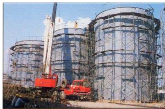
Chế tạo và lắp đặt bồn dầu 3.000m