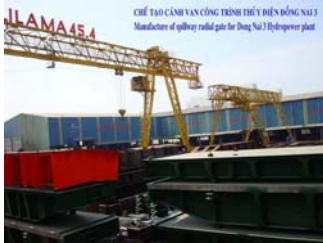
Chế tạo cánh van Thủy điện Đồng Nai 3