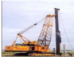
Đóng cọc tại công trình kính nổi Bình Dương