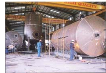
Hàn chế tạo bồn Gas