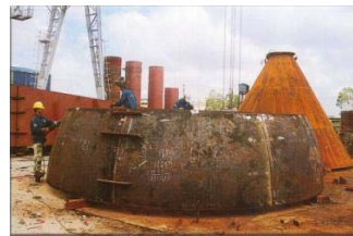
Hàn chế tạo nồi nấu bột giấy